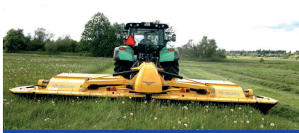
OY ELHO AB