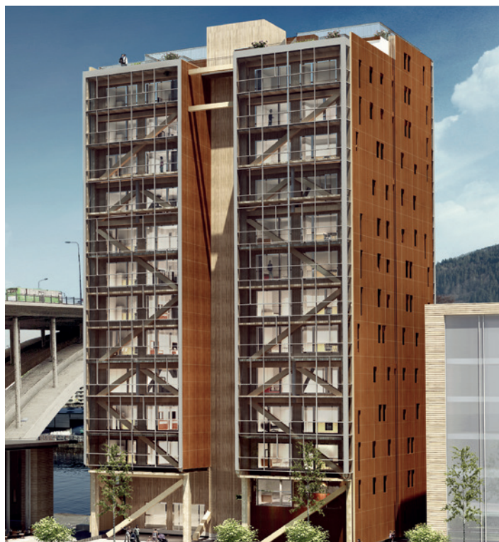
« Treet » à Bergen, Norvège, le bâtiment en bois le plus haut du monde – 52 mètres de haut et 14 étages. Teknos a fourni TEKNOS FR Façade et TEKNOS FR Panel.

Les produits à base de bois ignifugés doivent, sur le site des fabricants, être certifié par un « Organisme notifié » qui émet un « Certificat de constance de performances » après inspection préalable des sites de production du fabricant et mise en oeuvre de la documentation. La norme produit exige que le fabricant ait un système de contrôle de qualité en fonctionnement. Tous les produits traités avec des produits ignifuges de Teknos sont adaptés à la Réglementation sur les produits de construction n° 305/2011 et peuvent donc porter la marque CE.