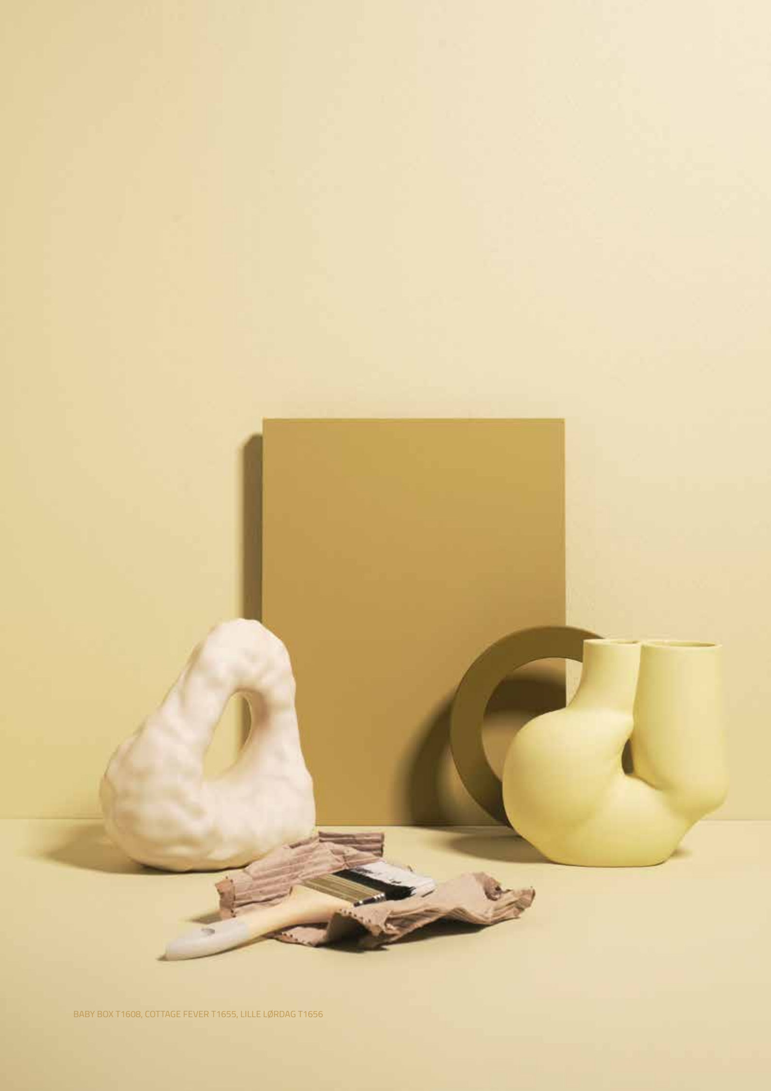
BABY BOX T1608, COTTAGE FEVER T1655, LILLE LØRDAG T1656