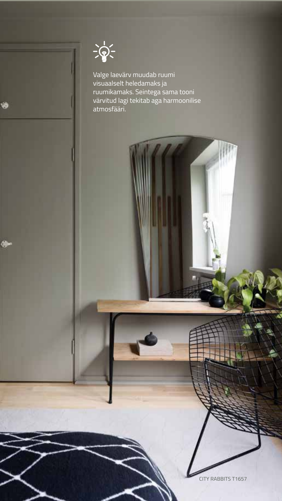
CITY RABBITS T1657

Valge laevärv muudab ruumi visuaalselt heledamaks ja ruumikamaks. Seintega sama tooni värvitud lagi tekitab aga harmoonilise atmosfääri.