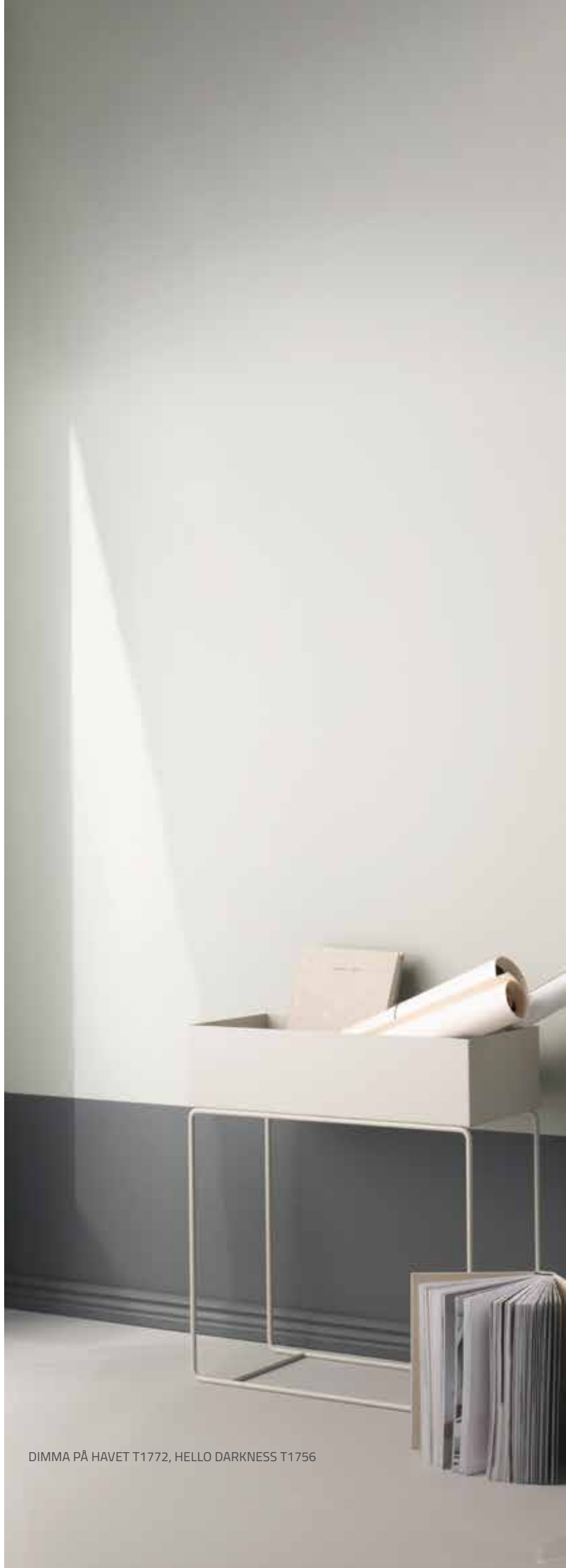
DIMMA PÅ HAVET T1772, HELLO DARKNESS T1756

OLE KANNATLIK Värv lõplikuks kõvastumiseks ja optimaalse kulumiskindluse saavutamiseks läheb kuni neli nädalat. Värvitud pinna puhastamiseks kasuta neutraalset pesuainet ja tee alati proovipuhastamine märkamatus kohas.