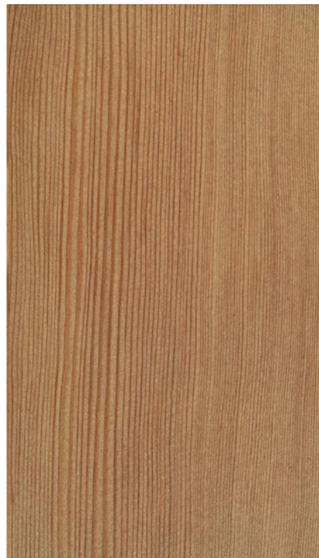
Holzoberfläche von Hemlock (Radialschnitt)