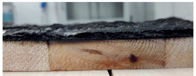
NACH DEM KONTAKT MIT DER FLAMME BILDET SICH AUF DEM SUBSTRAT EINE HOLZKOHLESCHICHT

Die in den Klassifizierungspapieren vorgegebenen Schichtstärken müssen bei der Beschichtung der Bauteile eingehalten werden, um die Brandschutzklasse B s1,d0 zu erreichen. Hierbei sind sowohl die Mindest-, als auch Maximalauftragsmenge der TEKNOSAFE Produkte zu beachten und im Prozess zu kontrollieren. Die Flexibilität der TEKNOSAFE Produkte zeigt sich bei der Anwendung. Sie können sowohl direkt im Werk als auch nach der Montage der Bauteile auf der Baustelle appliziert werden. Hierfür wird nur ein Airmix/Airless-Gerät benötigt, um die TEKNOSAFE Grundierung und den Decklack aufzubringen. Im Werk beschichtete Produkte müssen für den Transport zur Baustelle besonders geschützt werden. Beschädigungen der Oberfläche können dazu führen, dass das TEKNOSAFE Beschichtungssystem seine Schutzwirkung nicht mehr voll entfalten kann.