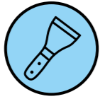
TERÄSHARJA, TAI LASTA