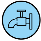
VESILETKU TAI PAINEPESURI