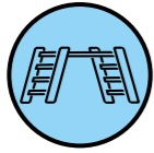
KUNNOLLISET TELINEET TAI PUKIT