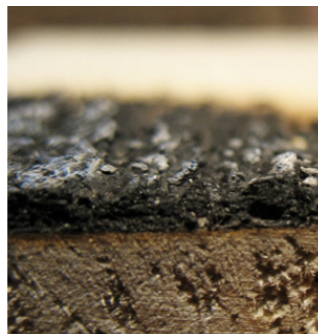
Fotot visar det skyddande förkolnade skiktet.

Om branden fortsätter förkolnas träets yttre skikt utan att antändas. Tack vare dessa egenskaper kan trä som behandlats med TEKNOSAFE även skydda underliggande material från brand och är godkänt enligt brandklass K 1 10 och K 2 10.