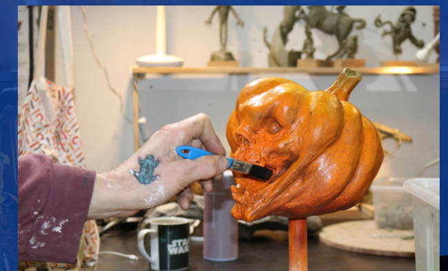
En halloweenpumpa tillverkad av frigolit, målade med polyurea och utsmyckad med pensel.