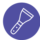
STÅLBORSTE ELLER SPATEL