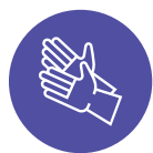
SKYDDSUTRUST- NING FÖR MÅLARE OCH MILJÖN