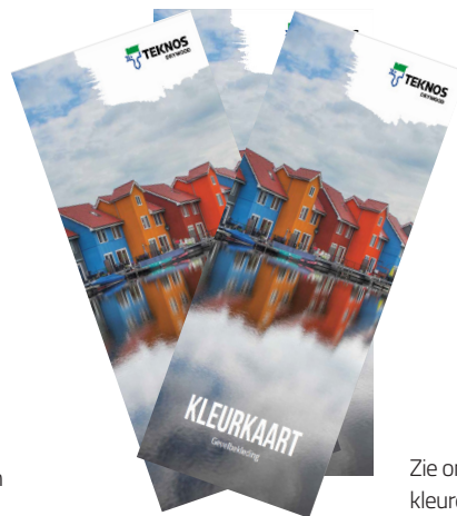
Zie onze kleurkaart voor de beschikbare kleuren