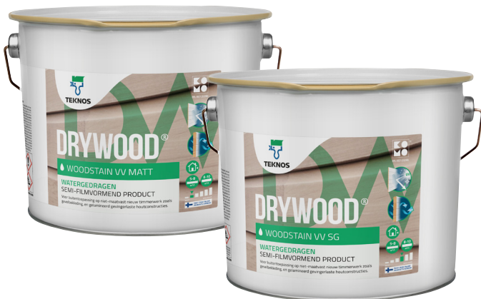
DRYWOOD WOODSTAIN VV is beschikbaar in 20 liter, 10 liter, 3 en 1 liter blikken.

Het onderhoudsinterval is aangegeven voor het weergegeven jaar, echter kan dit eerder of later zijn, afhankelijk van de ondergrond, de belasting en de situatie. Eventueel kan het noodzakelijk zijn om sterk aan verwerking blootgestelde delen of plaatsen tussentijds bij te werken. De gegeven instructies dienen slechts als richtlijnen, aangezien de weersbelasting, de houtsoort en de bewerking hiervan, de toestand van het oppervlak etc. in elke situatie anders zijn. De gebruiker dient voor het aanbrengen te bepalen of het product geschikt is. Raadpleeg voor meer informatie uw verfleverancier of Teknos B.V.