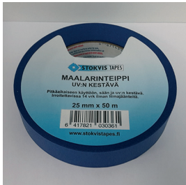
Stokvis Tapes maalanteippi, UV:n kestävä (sininen)