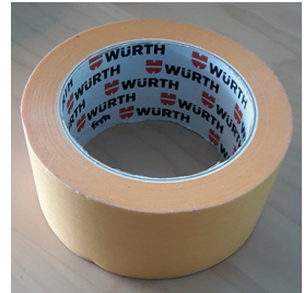
Würth paperiteippi (vaaleanoranssi)