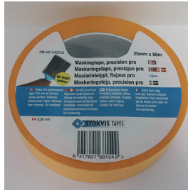
Stokvis Tapes maalanteippi, Rajaus pro (vaaleanoranssi)