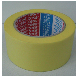
Tesa 4334 Precision Masking Tape (keltainen)