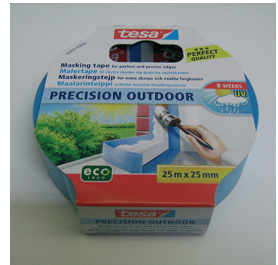
Tesa Precision Outdoor (vaaleansininen)

Yllämainittujen teippien valikoima vaihtelee eri rauta- ja maali kauppaketjuissa. Teipeissä saattaa olla eri leveyksiä ja teipin väri tulee ottaa huomioon. Kaikki teippiversiot tulisi poistaa maalipinnoilta mahdollisimman pian, kuitenkin viimeistään viikon kuluttua maalaustyön päättymisen jälkeen. Lisäksi suosittelemme teippauksen tekemistä ovien ja ikkunoiden karmiin jolloin mahdollisten vaurioiden korjaaminen on helpompaa.