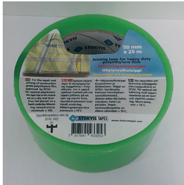
Stokvis Tapes höyrynsulkuteippi (vihreä)

Testiemme mukaan seuraavat teipit soveltuvat parhaiten Teknoksen teollisilla ikkuna- ja ovimaaleilla maalatuille pinnoille: