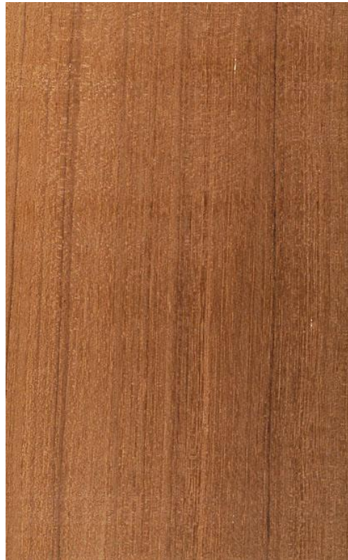
Holzoberfläche von Teak (Radialschnitt)