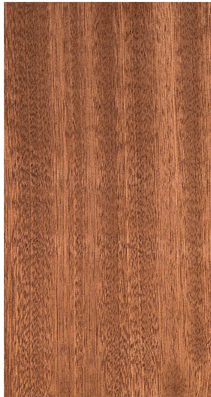
Holzoberfläche von Sapeli (Radialschnitt)