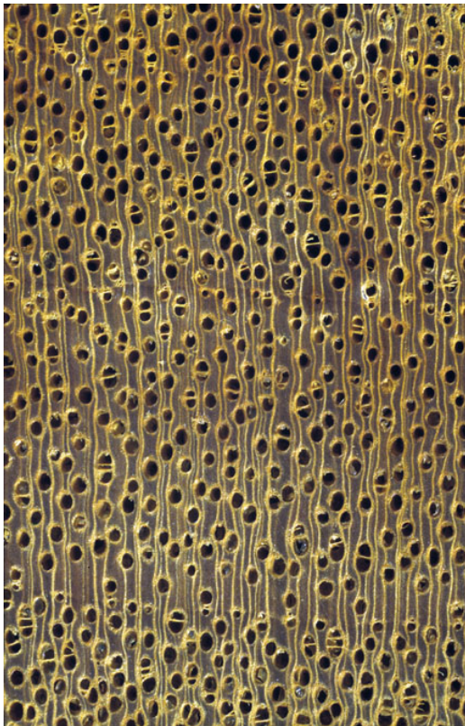
Makroskopischer Querschnitt von Framiré (10-fache Lupenvergrößerung)

Verwendung im Außenbereich, oder im Innenbereich; tragend, oder nicht tragend. Besonders geeignet für: Außenbau ohne Erdkontakt, Rahmenbau (Fenster, Haustüren, Wintergärten; Vollholz- und verleimte Kanteln).