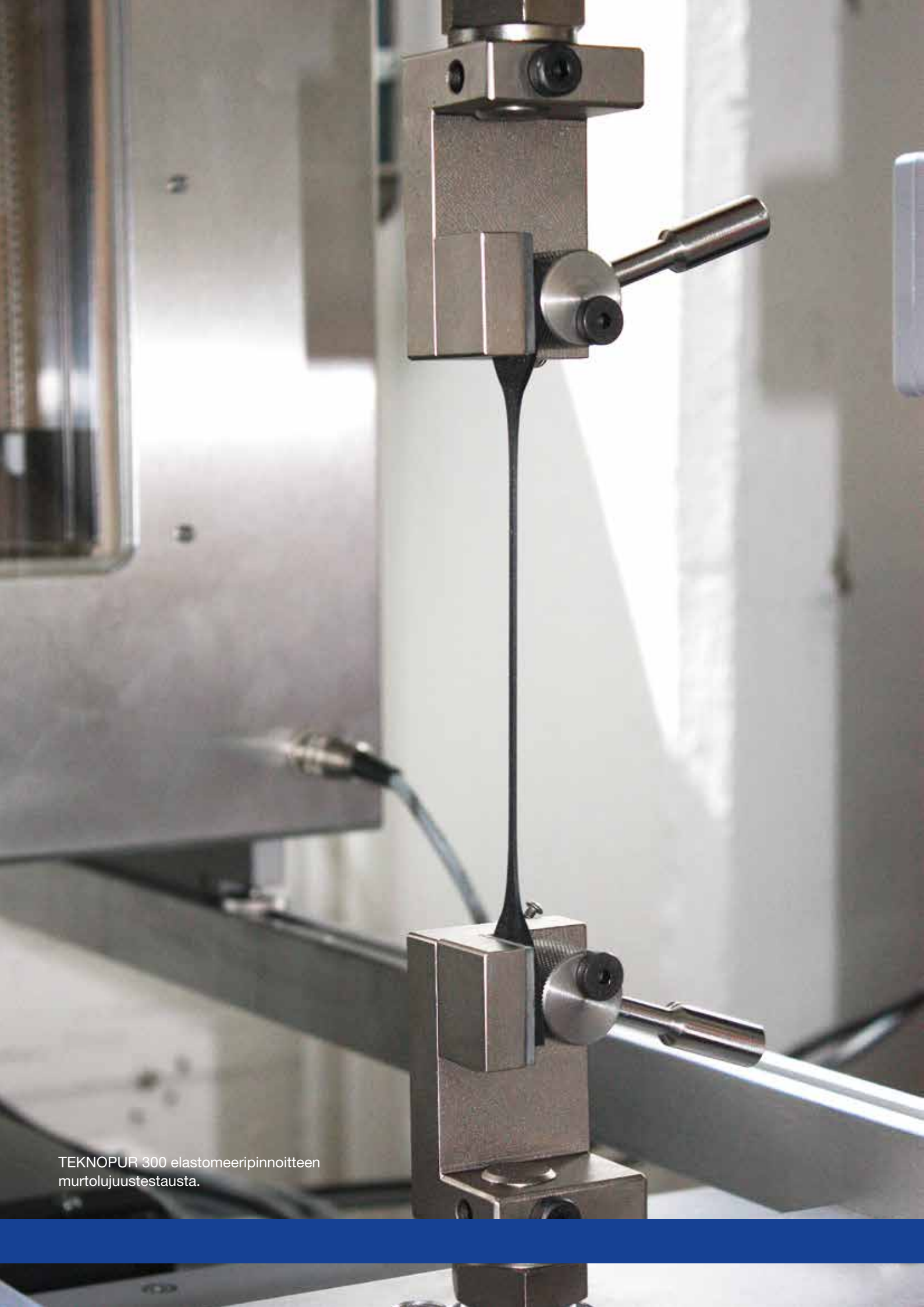
TEKNOPUR 300 elastomeeripinnoitteen murtolujuustestausta.