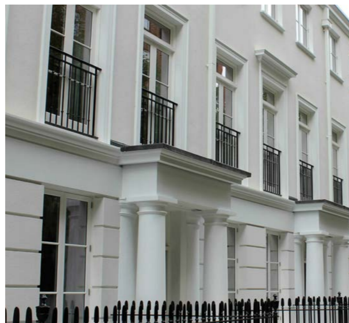
Accoya-vinduer overfladebehandlet med ANTISTAIN AQUA og AQUATOP

Besøg www.teknos.dk for at få flere oplysninger om overfladebehandlings- og vedligeholdelsessystemer og find din nærmeste Teknos-konsulent.