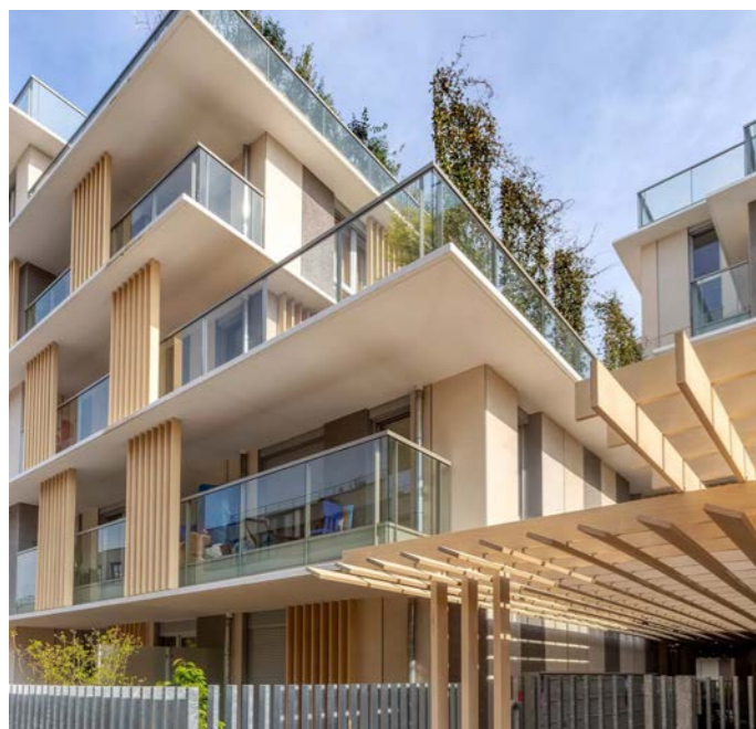
Accoya-solskærme overfladebehandlet med AQUAPRIMER og AQUATOP