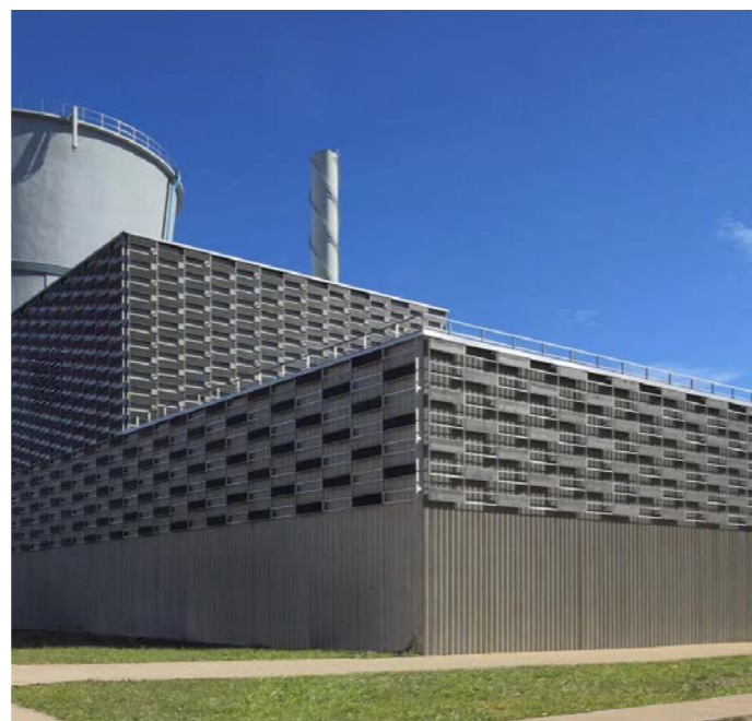
Accoya-facadeplader overfladebehandlet med TEKNOL AQUA og NORDICA EKO