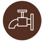
VESILETKU TAI PAINEPESURI