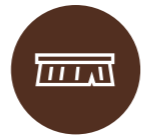
TERÄSHARJA, TAI LASTA