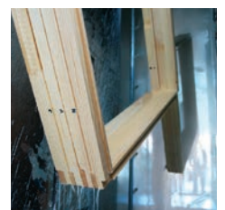
▲ Transparent AQUAPRIMER 2907-02 til flowcoat

Vores tekniske serviceorganisation er altid klar til at hjælpe dig med at udforme den optimale overfladebehandlingsløsning og det ideelle påførings-system.